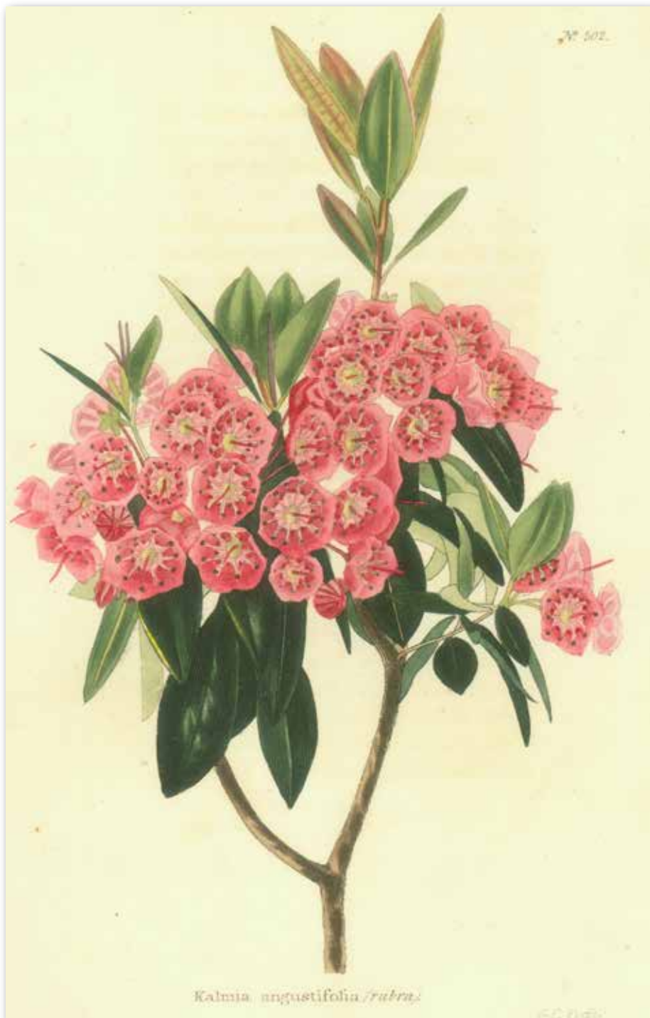
Le kalmia à feuilles étroites.

En 1605, Samuel de Champlain est le premier Européen à décrire en sol nord-américain le topinambour ( Helianthus tuberosus ), une espèce alimentaire apparentée au tournesol ( Helianthus annuus ). Une partie importante du plan d'affaires de Champlain présenté à Paris en 1618 repose sur les revenus générés par la vente de végétaux utilitaires, comme les bois, les plantes à fibres textiles, les gommes et les résines et même une plante tinctoriale au latex rouge (sanguinaire du Canada, Sanguinaria canadensis ) 24 . L'exploitation des ressources naturelles végétales est toujours d'actualité en Nouvelle-France.