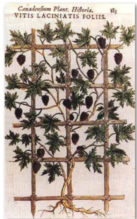
Une vigne d'Amérique (?) illustrée en 1635.

Les jardins d'Europe exhibent rapidement et fièrement des plantes du Nouveau Monde, incluant celles associées aux premières explorations « canadiennes » en Nouvelle-France. En 1635, Jacques Cornuti 5 , médecin parisien, publie la toute première flore nord-américaine. Il décrit plus de 40 espèces canadiennes ou nord-américaines qu'il observe pour la plupart dans le jardin de Jean et